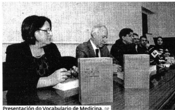
Presentación do Vocabulario de Medicina. DP

Facilitar a tarefa de falar e escribir sobre medicina en galego a quen ensina ou se forma é o principal cometido do 'Vocabulario de Medicina' que o Servizo de Normalización Lingüística (SNL) da USC elaborou, coa colaboración da Consellaría de Sanidade, logo de cinco anos de traballo.